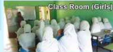
Class Room (Girls)