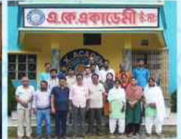
এ.কে. অ্যাকাডেমী মিশনের শিক্ষক/শিক্ষিকাবৃন্দ

Contact No. - 8373072833 / 933/733, 9775992269, 7718628345, 8515048365