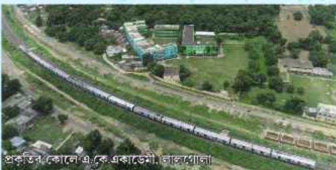
প্রকৃতির কোলে এ.কে.একাডেমী, লালগোলা।