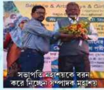
সভাপতি মহাশয়কে বরণ করে নিচ্ছেন সম্পাদক মহাশয়।