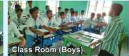
Class Room (Boys)